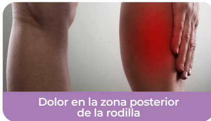
Dolor en la zona posterior de la rodilla