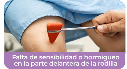
Falta de sensibilidad o hormigueo en la parte delantera de la rodilla