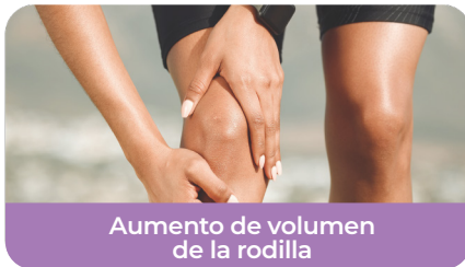
Aumento de volumen de la rodilla

Durante los próximos días experimentarás cambios que son habituales en el proceso de recuperación, los cuales son: