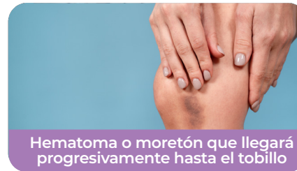
Hematoma o moretón que llegará progresivamente hasta el tobillo