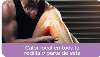
Calor local en toda la rodilla o parte de esta